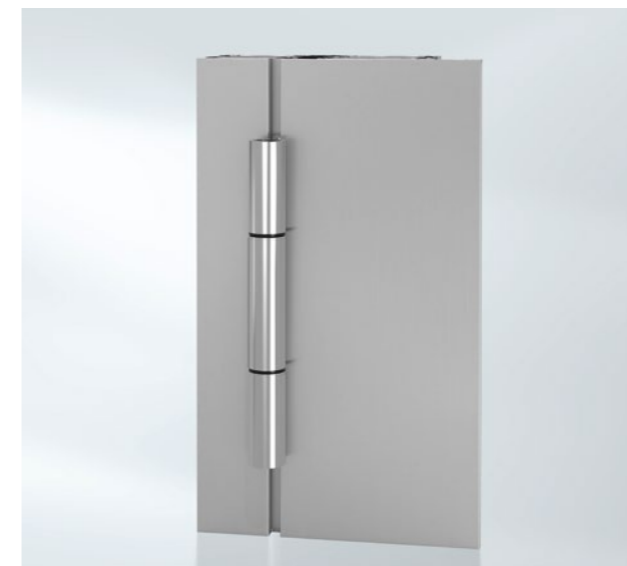
ROLLENTÜRBAND in EV1 / weiß / RAL 9005 / Edelstahl-Look erhältlich

Türbänder ermöglichen die Beweglichkeit der Haustür, indem sie Rahmen und Türflügel verbinden. Sie müssen das gesamte Gewicht des Türflügels tragen, eine dauerhaft sichere Funktionalität gewährleisten und zudem ästhetische Kriterien erfüllen. Verdeckt liegende Bänder sind in geschlossenem Zustand nicht sichtbar.