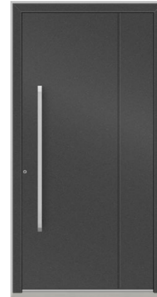
APPENZELL geschlossen, mit Nut, Oberfläche DB 703, Griff KCR1150 Edelstahl