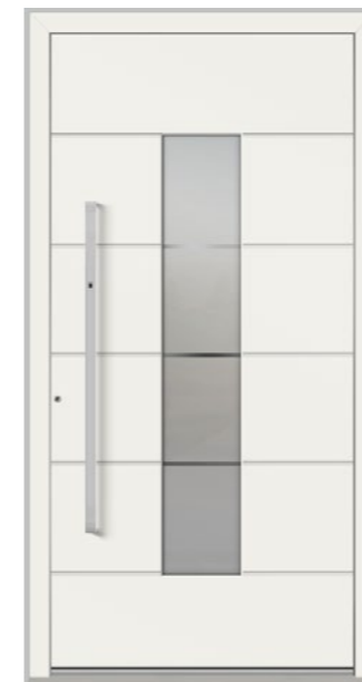
GENF 1 Feld verglast, Glas 3-fach ISO, Dekorglas DPL sandgestrahlt auf Satinato, mit Nuten, Oberfläche RAL 9016, Griff KCKF1150 Ekey Edelstahl