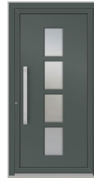
JURA 4 Felder verglast, Glas 3-fach ISO, Ornament Satinato weiß, Oberfläche RAL 7012, Griff DOK750 Edelstahl