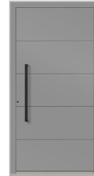
BELLINZONA geschlossen, mit Nuten, Oberfläche RAL 9007, Griff KCK750 RAL 9005