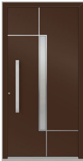
WÄDENSWILL 1 Feld verglast, Glas 3-fach ISO, Ornament Satinato weiß, Applikationen Edelstahl, Oberfläche RAL 8077, Griff DOS 750 Edelstahl