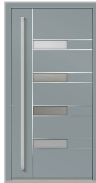
YVERDON 4 Felder verglast, Glas 3-fach ISO, Ornament Satinato weiß, Applikationen Edelstahl, Oberfläche RAL 7001, Griff KCK1900 Edelstahl