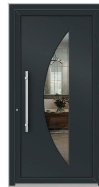
CHUR 1 Feld verglast, Glas 3-fach ISO, Klarglas, Oberfläche RAL 7016, Griff KCD750 Edelstahl