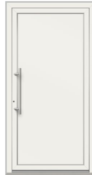
AARAU geschlossen, Oberfläche weiß RAL 9016, Griff G1 600 mm Edelstahl