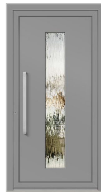
URI 1 Feld verglast, Glas 3-fach ISO, Ornament Silvit weiß, Oberfläche RAL 9007, Griff KCK750 Edelstahl