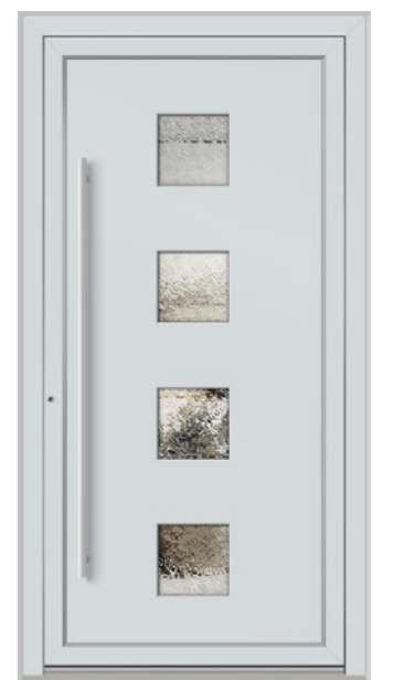
GRAUBÜNDEN 4 Felder verglast, Glas 3-fach ISO, Ornament Delta weiß, Oberfläche RAL 7035, Griff OCR1400 Edelstahl

Beispielkonfigurationen – alle Füllungen und Ausstattungsmerkmale frei wählbar in unserem Haustürkonfigurator!