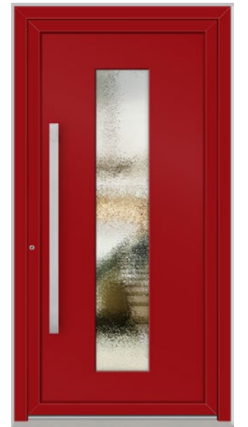
BIEL 1 Feld verglast, Glas 3-fach ISO, Ornament Chincilla weiß, Oberfläche RAL 3004, Griff DOS1150 Edelstahl