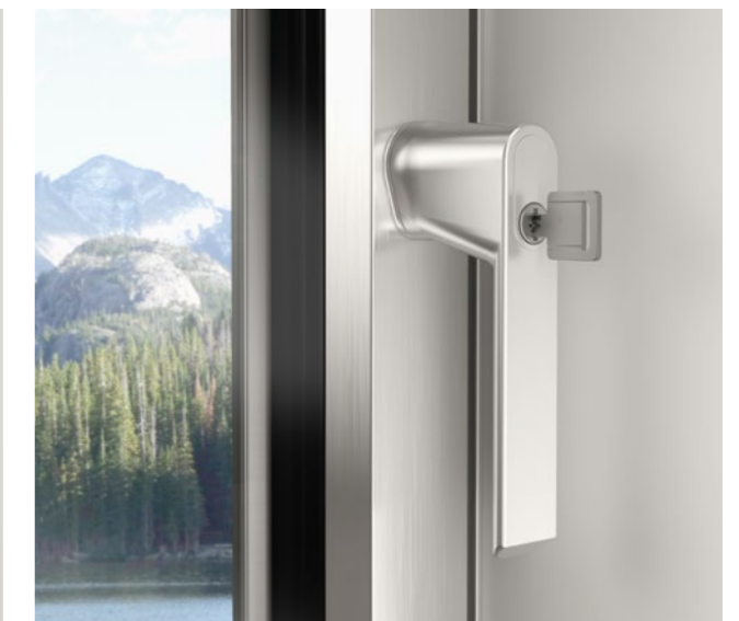
ROSETTENLOSES GRIFFDESIGN, ABSCHLIESSBAR