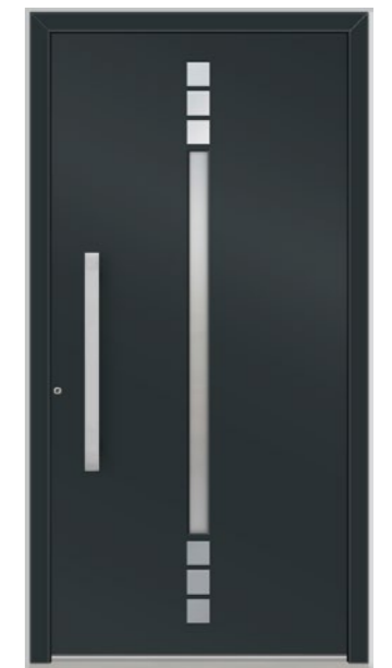
LUGANO 1 Feld verglast, Glas 3-fach ISO, Ornament Satinato weiß, Applikationen Edelstahl, Oberfläche RAL 7016, Griff DOS750 Edelstahl

Beispielkonfigurationen – alle Füllungen und Ausstattungsmerkmale frei wählbar in unserem Haustürkonfigurator!