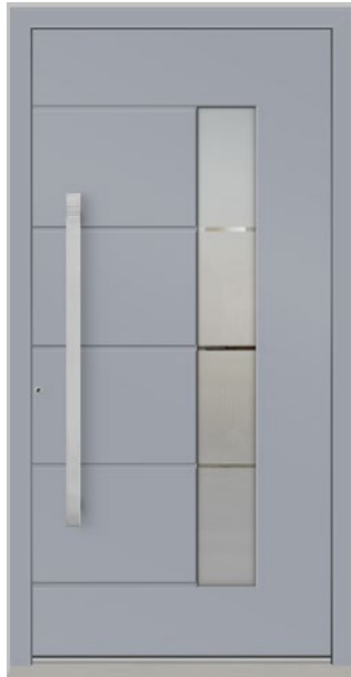
SCHAFFHAUSEN 1 Feld verglast, Glas 3-fach ISO, Dekorglas DPH sandgestrahlt auf Klarglas, mit Nuten, Oberfläche RAL 7040, Griff DOK1150 Edelstahl