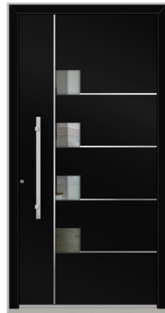
WINTERTHUR 4 Felder verglast, Glas 3-fach ISO, Klarglas, Applikationen Edelstahl, Oberfläche RAL 9005, Griff KCD750 Edelstahl