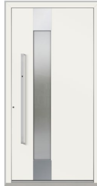
TESSIN 1 Feld verglast, Glas 3-fach ISO, Ornament Satinato weiß, Applikationen Edelstahl, Oberfläche RAL 9016, Griff KCKF1150 Ekey Edelstahl