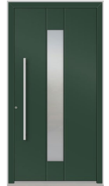
DAVOS 1 Feld verglast, Glas 3-fach ISO, Ornament Satinato weiß, mit Nuten Oberfläche RAL 6005, Griff OCR1000 Edelstahl