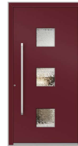
GLARUS 3 Felder verglast, Glas 3-fach ISO, Ornament Delta weiß, Oberfläche RAL 3005, Griff KCR1150 Edelstahl