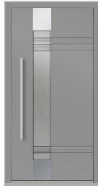
SION 1 Feld verglast, Glas 3-fach ISO, Dekorglas DPZ sandgestrahlt auf Satinato, Applikationen Edelstahl, mit Nuten, Oberfläche RAL 9007, Griff OCR1000 Edelstahl