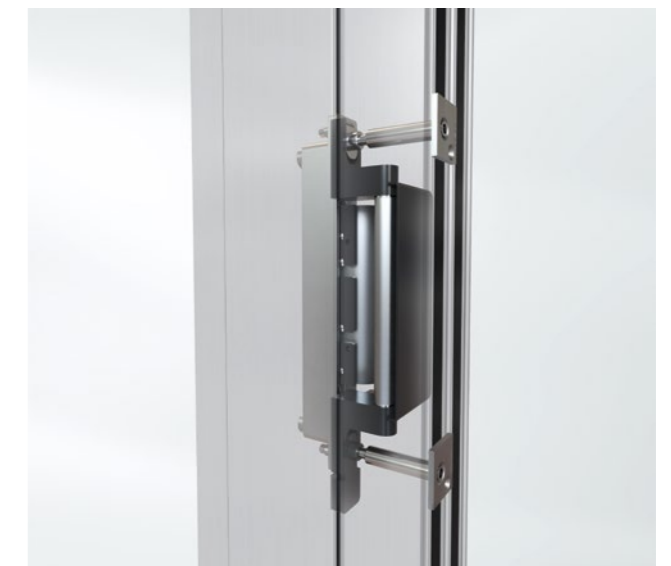
VERDECKT LIEGENDES BAND